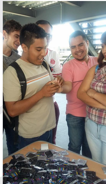
Los jóvenes practicando como poner el condón

“La comunidad de los martines siempre en apoyo a los jóvenes en educación sexual”