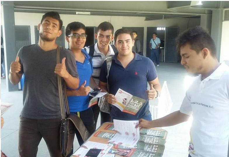
Entrega de folletos a los estudiantes del CU Tonalá

Con el aumento de la transmisión del VIH entre jóvenes, la Comunidad de los Martines tiene como una prioridad tocar esta población. Muchos no saben del VIH. No han vivido la “crisis de la pandémica.” Ir a universidades y ser presente es parte de nuestro trabajo. Difusión de condones, volantes informativos y la aplicación de la prueba rápida son nuestros instrumentos de trabajo.